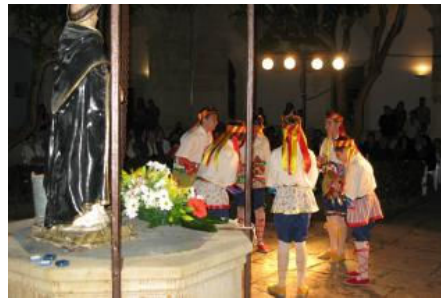
El pasado miércoles danzaron los actuales 'moretons', en el claustro.